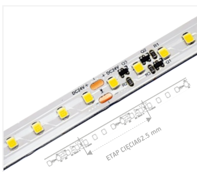
IP 20 | 112 LEDS