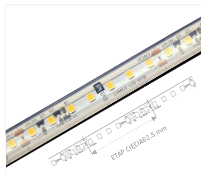
IP 67 | 112 LEDS